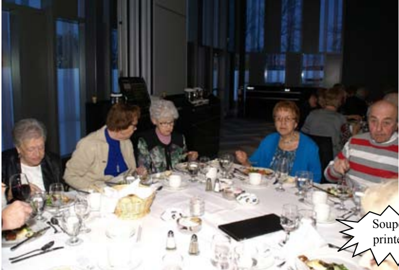
Souper du printemps