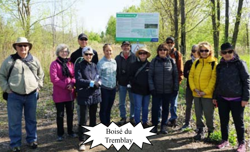
Boisé du Tremblay