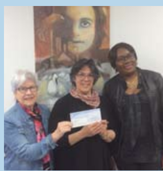
ABRI DE LA RIVE-SUD