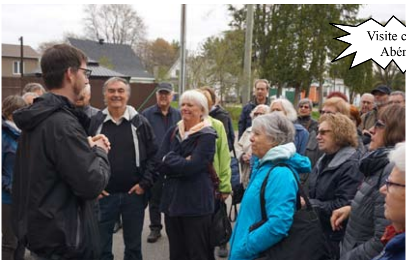
Visite chez les Abénakis