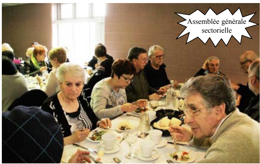
Assemblée générale sectorielle