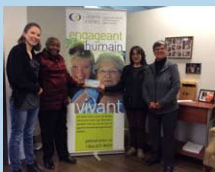
LES PETITS FRÈRES