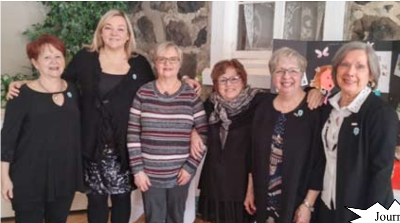
Journée des femmes