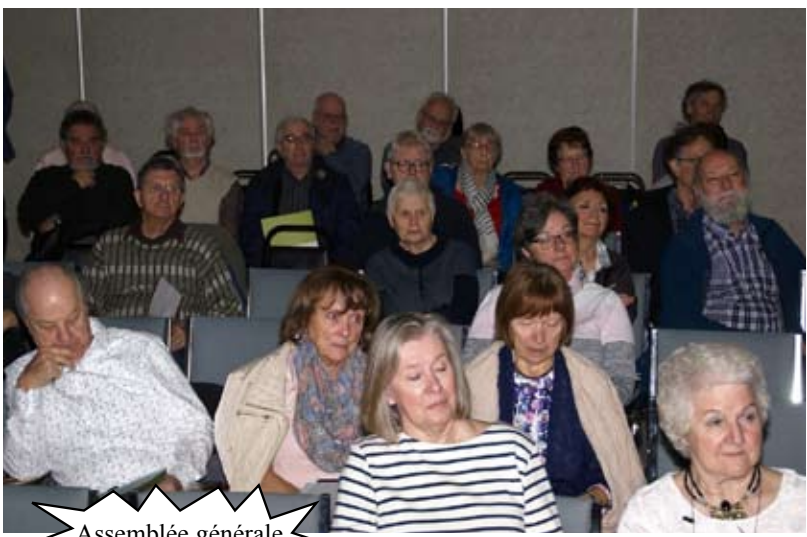
Assemblée générale sectorielle