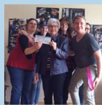
LA MAISON SAC-ADO